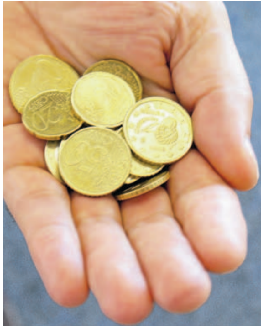
Beim freundlichen Wechseln von Kleingeld wurde am Mittwoch ein Gifhorer Rentnerpaar in der Innenstadt ausgetrickst. Die Polizei fahndet nach einem jungen Gaunerpärchen. Symbolfoto: Westermann

Dass seine Hilfsbereitschaft auf gemeine Art ausgenutzt worden war, bemerkte der Rentner erst später bei einem anschließenden Besuch der Commerzbank, als er sein Portemonnaie benötigte. Es war nicht mehr in seiner Jackentasche. In dem Portemonnaie befanden sich außer ein paar Euro Ausweise und Scheckkarte. Offensichtlich hatten es der Fremde oder seine Begleiterin während des Wechselvorganges aus der Jackentasche gezogen.